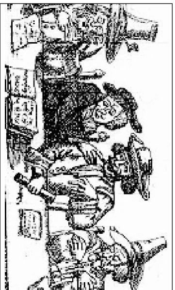
Spottbild zum „Braunauer Parlament“